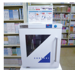
殺菌ブッククリーン「COCOCHI(こちこ)」

国試対策は今まで補講として行っていましたが、2020年からは臨床基礎統合ゼミ(CUP)の科目として、授業と模擬試験を繰り返し行い、試験後に必ず解説を行うこととしました。解説では解説本に載っていないようなことや教員の体験や失敗談を話すことで意識付けを行いました。