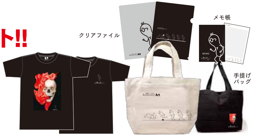
オリジナルT-シャツ