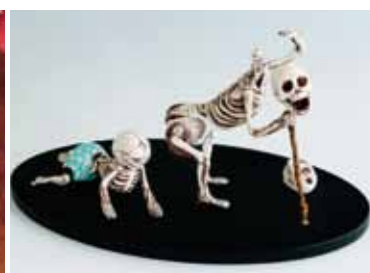
人生、「呆け」「俺の頭は何処だ?」