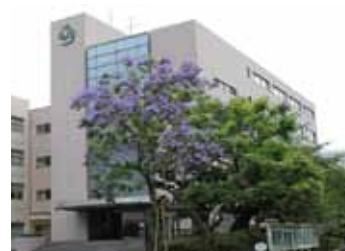
世界三大木花と呼ばれ、紫色の綺麗な花を咲かせる中南米産の植物「ジャカランダ」。