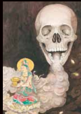
阿弥陀聖像 来迎図