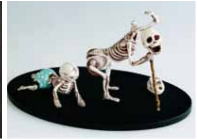
人生、「呆け」 「俺の頭は何処だ?」