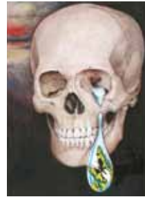
髑髏 儂き夏の蝶の夢

「生と死は表裏一体であり、生をユーモラスに語れるのであれば、死もユーモラスに語ることができる」という同氏の発想は、解剖学に携わり、生と死を取り持ってきた者ならではの感性であると言えます。