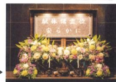
標本室入口の献体諸霊位