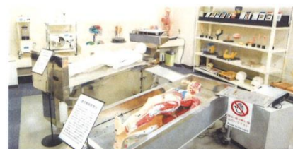
▲人体解剖に関する資料や解剖台、「アナトミーアート」も紹介。

※各回共に先着順にて定員15名様までとさせていただきます。定員に達した場合はお申込みをお断りさせて頂く旨何卒ご了承ください。